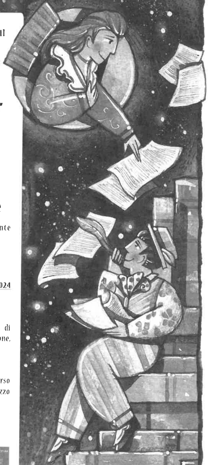
ILLUSTRAZIONE DI STEFANO POGGI "PENSIERI ALLA LUNA" WWW.POGGISTEFANO.IT